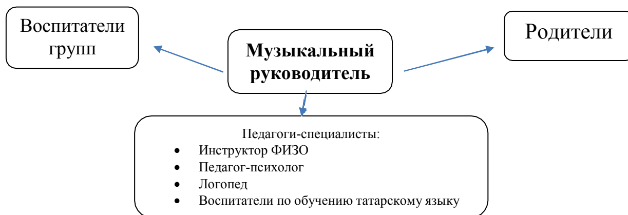
Схема организации работы по взаимодействию с другими участниками образовательного процесса

Музыкальная непосредственная образовательная деятельность состоит из трех частей.